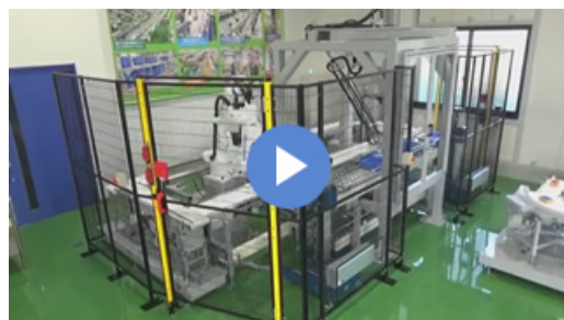
小型ロボットハンドリングライン