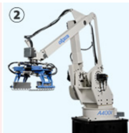
② ロボットパレタイザA400V (最大処理能力：400サイクル/h)