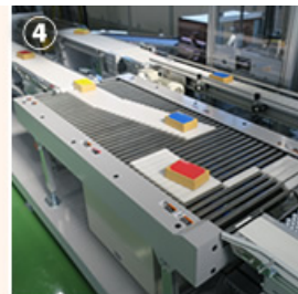
④ 高速3方向分岐装置 (最大分岐能力：18,000個/h)