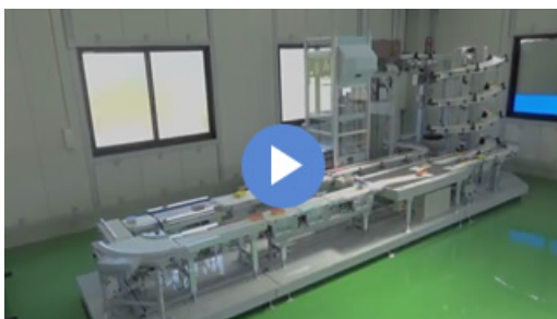
軽搬送コンベヤライン