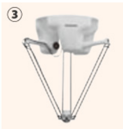
③ パラレルリンクロボット (最大処理能力：0.94秒/サイクル)