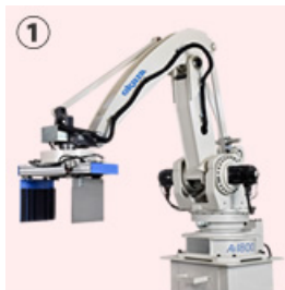
① ロボットパレタイザAi1800 (最大処理能力：1,720サイクル/h)